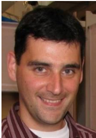
Wolfgang Dirscherl © privat