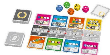
„HILO“ und „Man muss auch gönnen können“ von Schmidt Spiele © Schmidt Spiele

Zum ersten Mal wählte die Jury des Österreichischen Spielepreises Spiele für die Unterkategorien der begehrten „Spiele Hit“-Auszeichnung aus. Im Bereich Karten wurde „HILO“, die Herbstneuheit 2019 von Schmidt Spiele, gewürdigt. Zwei bis sechs Spieler ab acht Jahren versuchen hier durch geschicktes Ziehen hohe Karten gegen niedrige einzutauschen und ganze Reihen zu entfernen. Wer am Ende die wenigsten Punkte hat, gewinnt das bunte Kartenspiel. Die meisten Punkte versuchen Spieler hingegen bei „Man muss auch gönnen können“ zu erzielen, das die Jury als Trend überzeugte. Runde für Runde versuchen bis zu vier Spieler ab acht Jahren spezielle Würfel-Kombinationen zu erzielen, um sich Punkte für den Sieg zu sichern. Passive Spieler dürfen dabei die Würfel-Ergebnisse mitnutzen und dann heißt es als aktiver Spieler: „Man muss auch gönnen können“. Das Spiel kann auch in einer Einzelvariante gespielt werden.